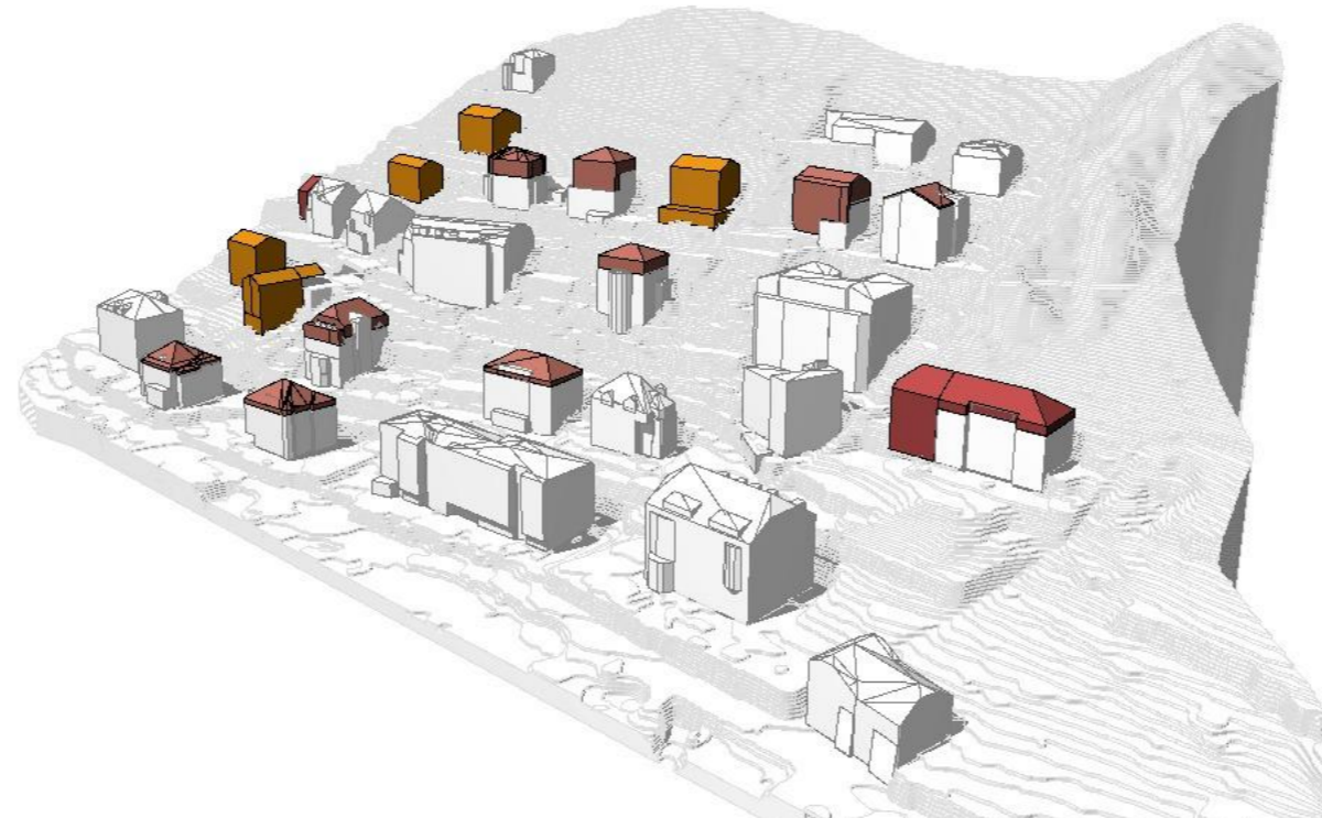
MODELL KUBATURVERTEILUNG DURCHFÜHRUNGSPLAN - ANSICHT SÜDOST MODELLO DISTRIBUZIONE DELLA CUBATURA PIANO DI ATTUAZIONE - VISTA SUD EST