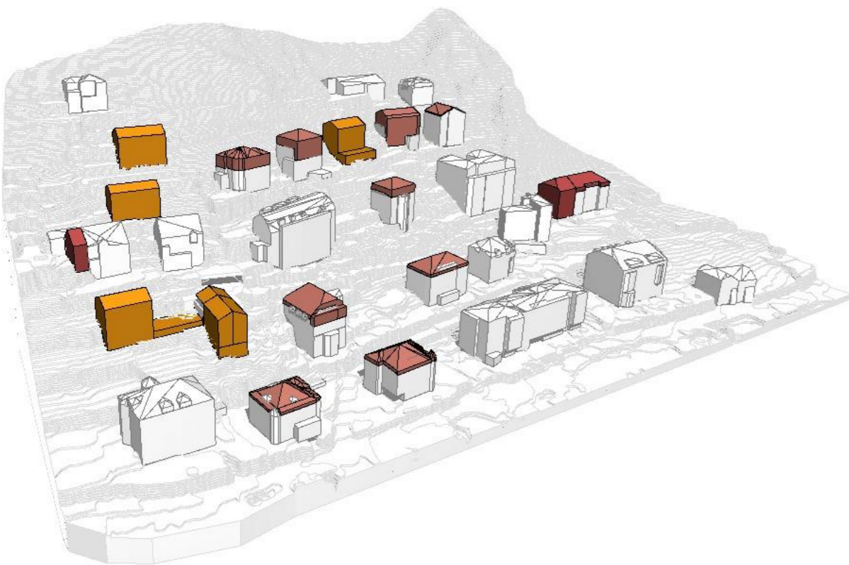
MODELL KUBATURVERTEILUNG DURCHFÜHRUNGSPLAN - ANSICHT SÜDWEST MODELLO DISTRIBUZIONE DELLA CUBATURA PIANO DI ATTUAZIONE - VISTA SUD OVEST