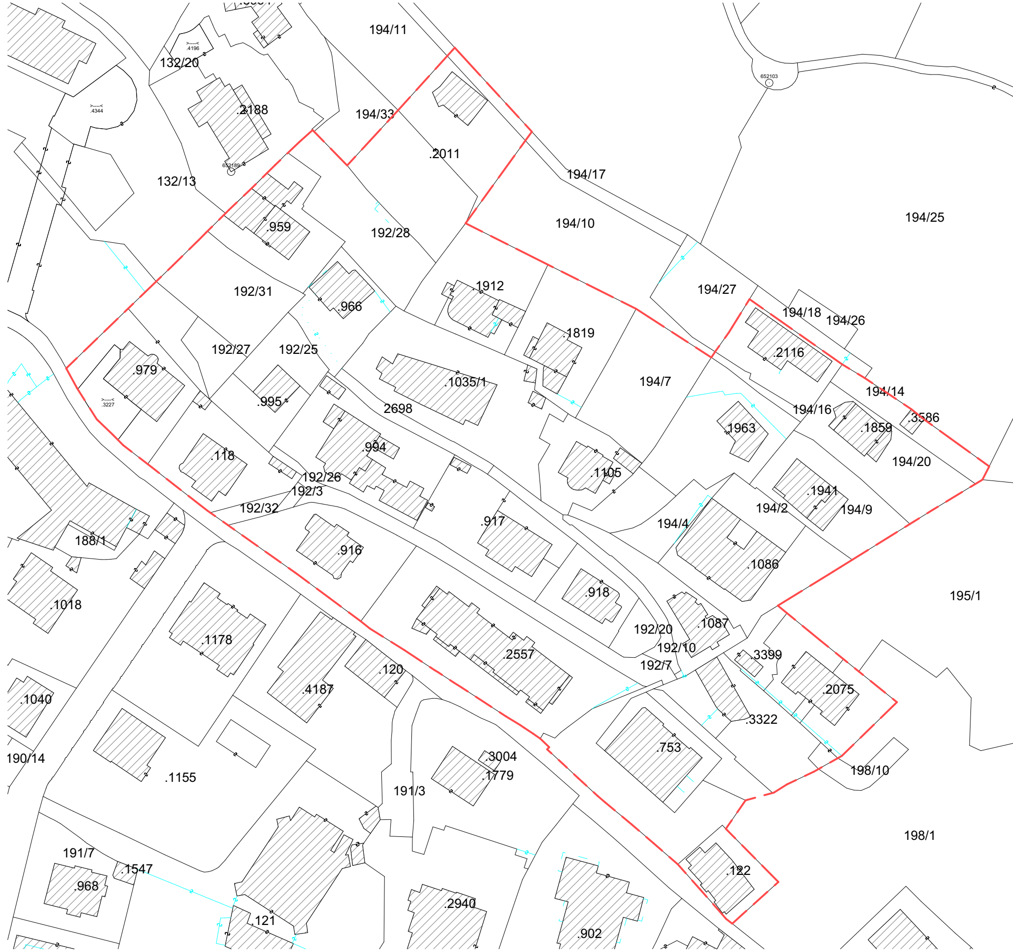
MAPPENAUSZUG / ESTRATTO MAPPA Maßstab - Scala 1:1000