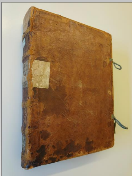
Il Liber iurium di Bolzano, conservato in Archivio Storico.

Tra le disposizioni del re si legge nell'atto che il consiglio dovrà essere votato annualmente il dodicesimo giorno dopo Natale « alle Jar an dem zwölftem nach dem weihnachttag » e dovrà essere composto da dodici membri, di cui tre rappresentanti della nobiltà e nove uomini onesti, « drey aus dem adl und neun erber man ».