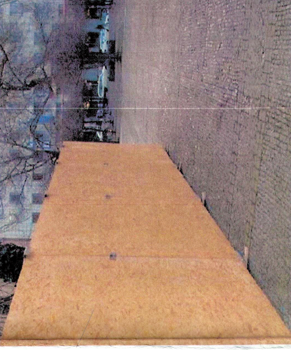
OSB Platten Pannelli OSB