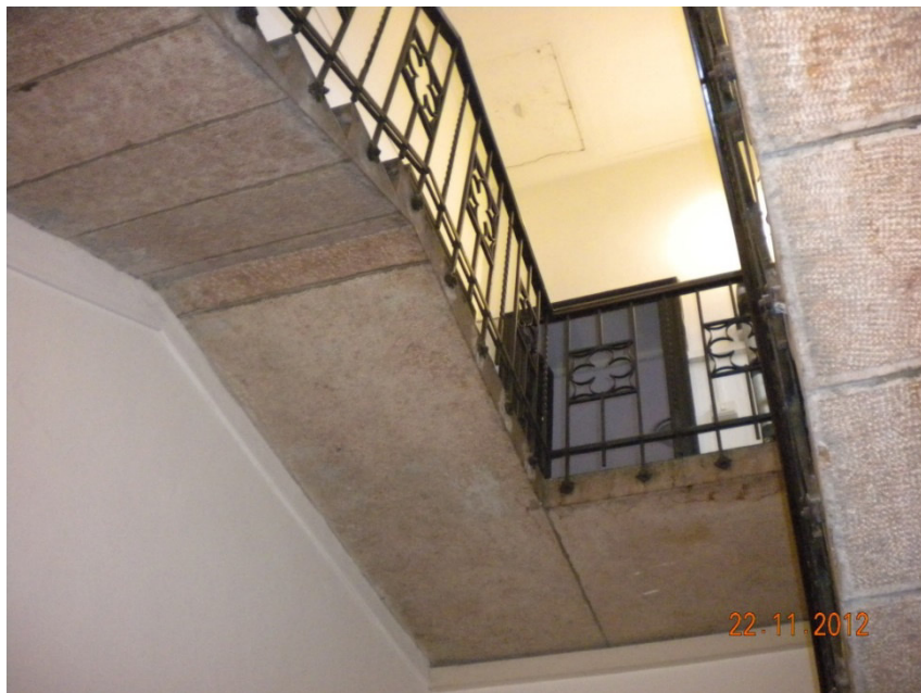
La scala interna - Innentreppe