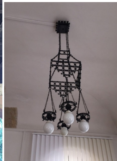
lampada interna – Innenlampe