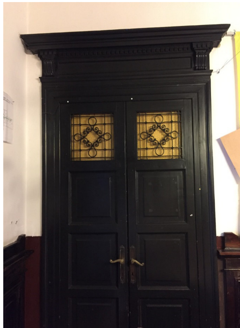
Porte interne - Innentüre