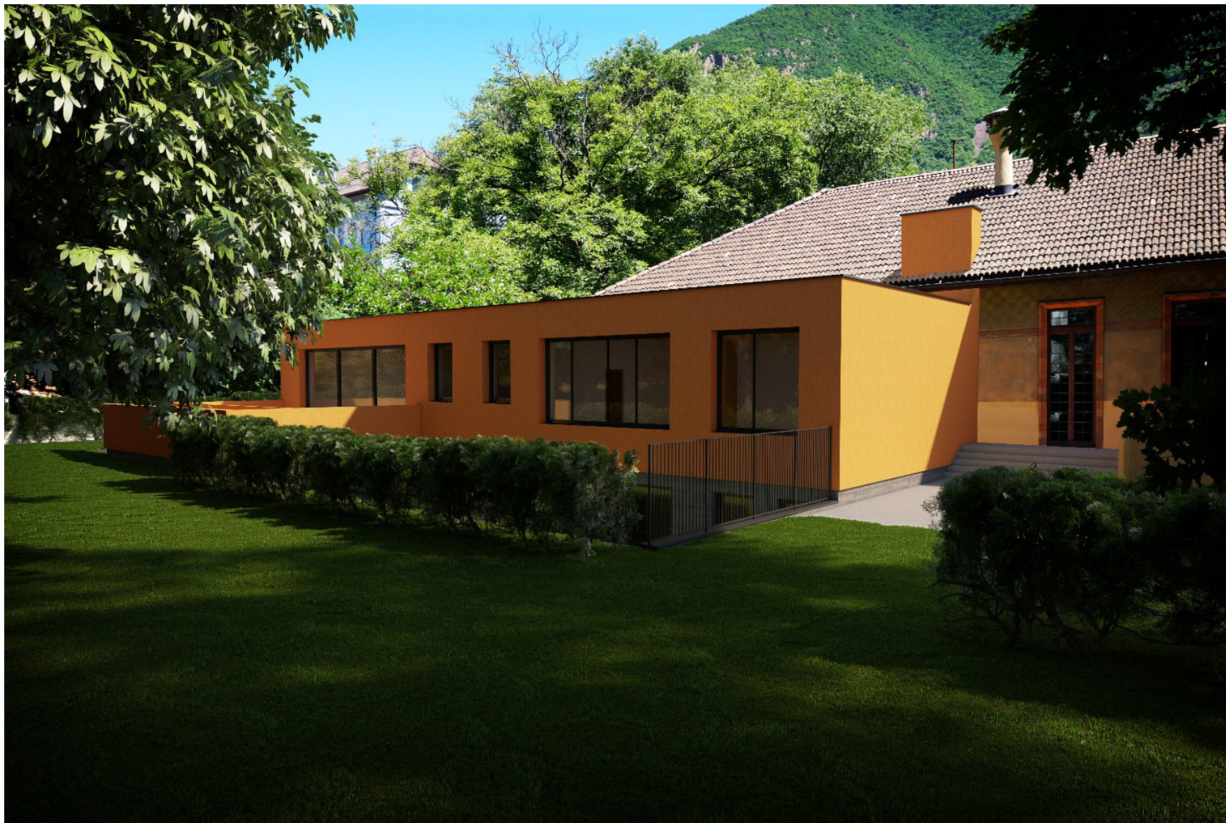
Render dell' ampliamento fronte giardino interno – Rendering der Erweiterung am Innengartenfront