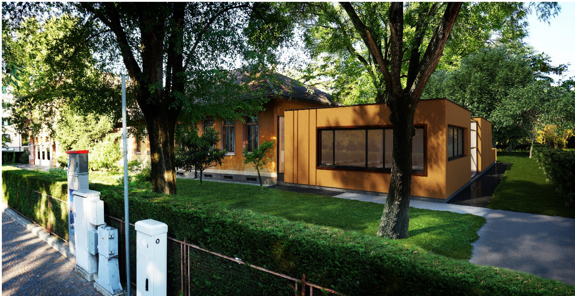
Render parte di ampliamento fronte via Claudia Augusta – Rendering der Erweiterung am Claudia Augusta Strassenfront