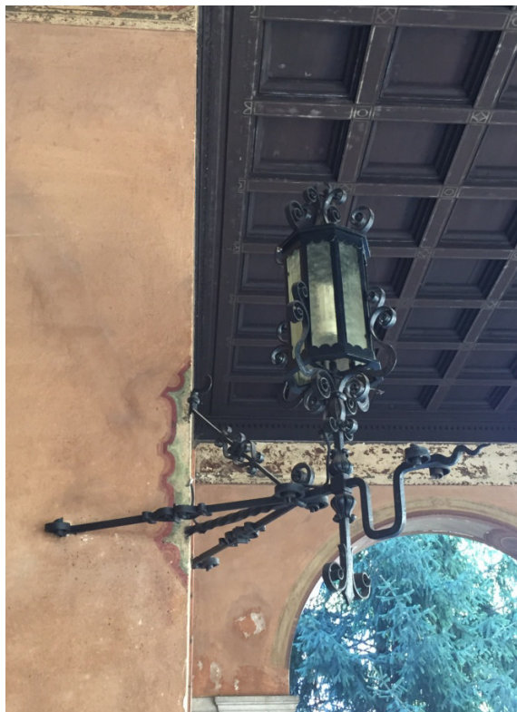
lampada esterna - Aussenlampe